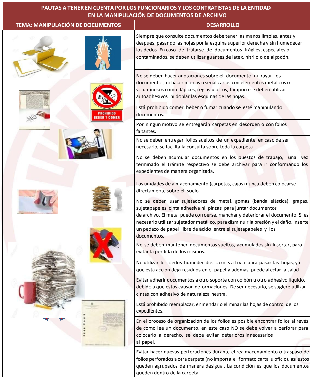
Tabla No. 2. Recomendaciones para la manipulación de documentos.