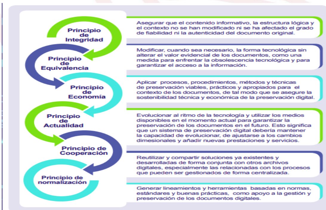
Gráfica 2. Principios de la preservación digital