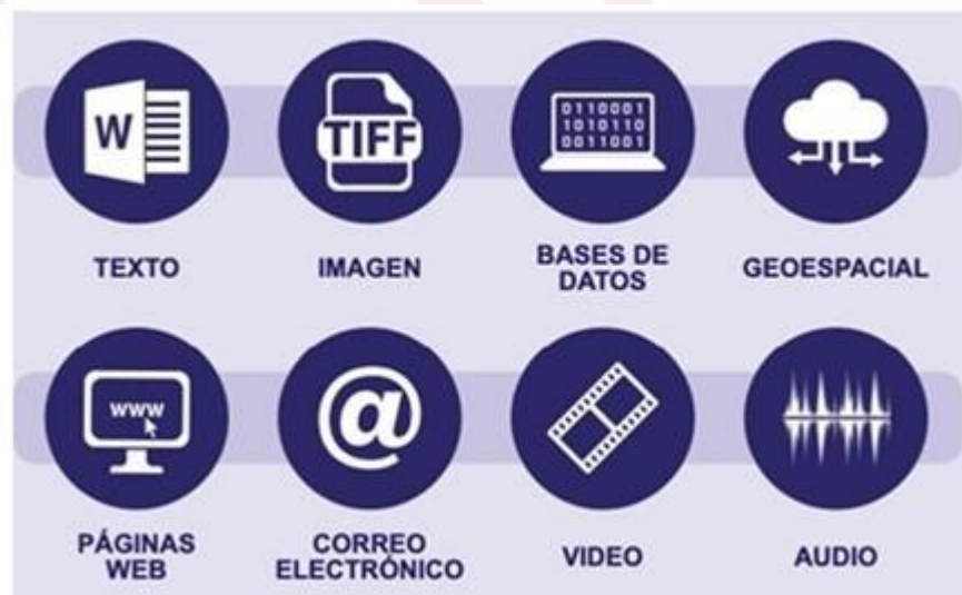
Gráfica 1. Los tipos de documentos objeto de preservación digital